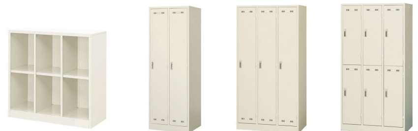
SL-6 LK-2 LK-3 LK-6