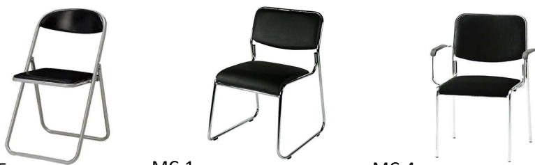
CR-5 MC-1 MC-4