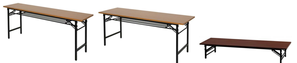
T2-N T4-N T-34